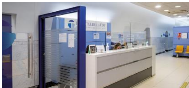
Admisión de consultas externas