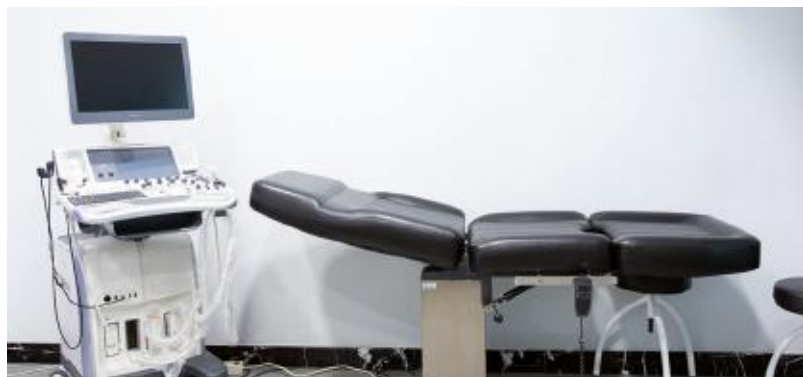
Unidad de diagnóstico por la imagen