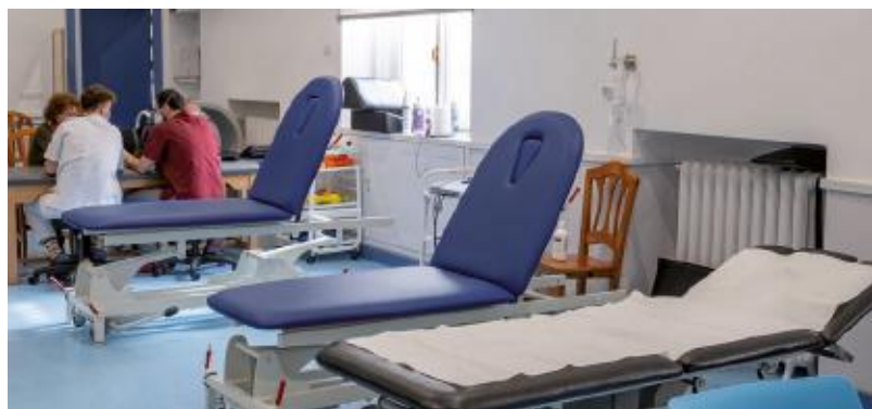
Unidad de rehabilitación y gimnasio